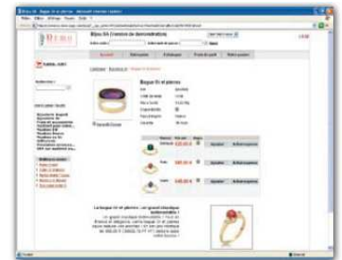
Publiez en quelques clics votre site marchand